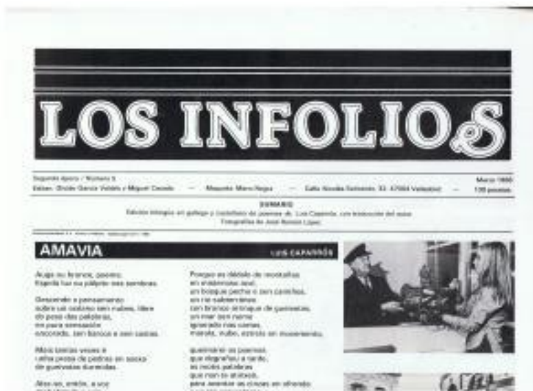
Revista "Los Inflios"