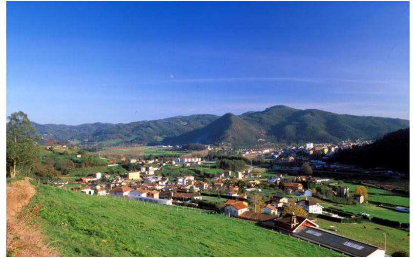
Santianes de Pravia, pueblo natal de Olvido.