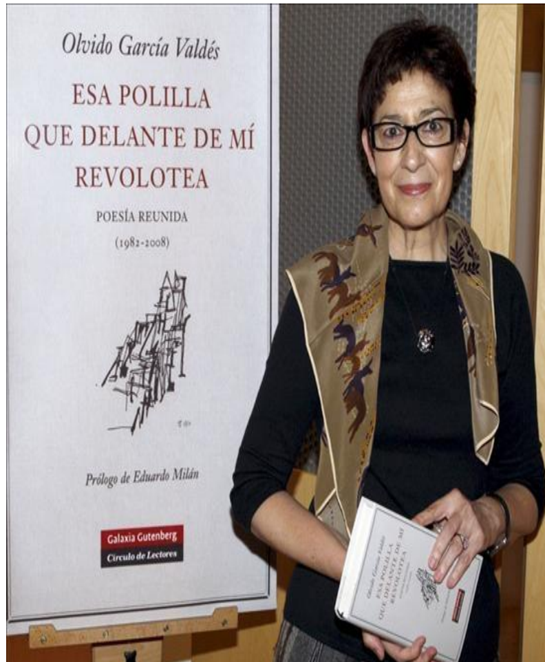
“Esa polilla que delante de mi revolotea”