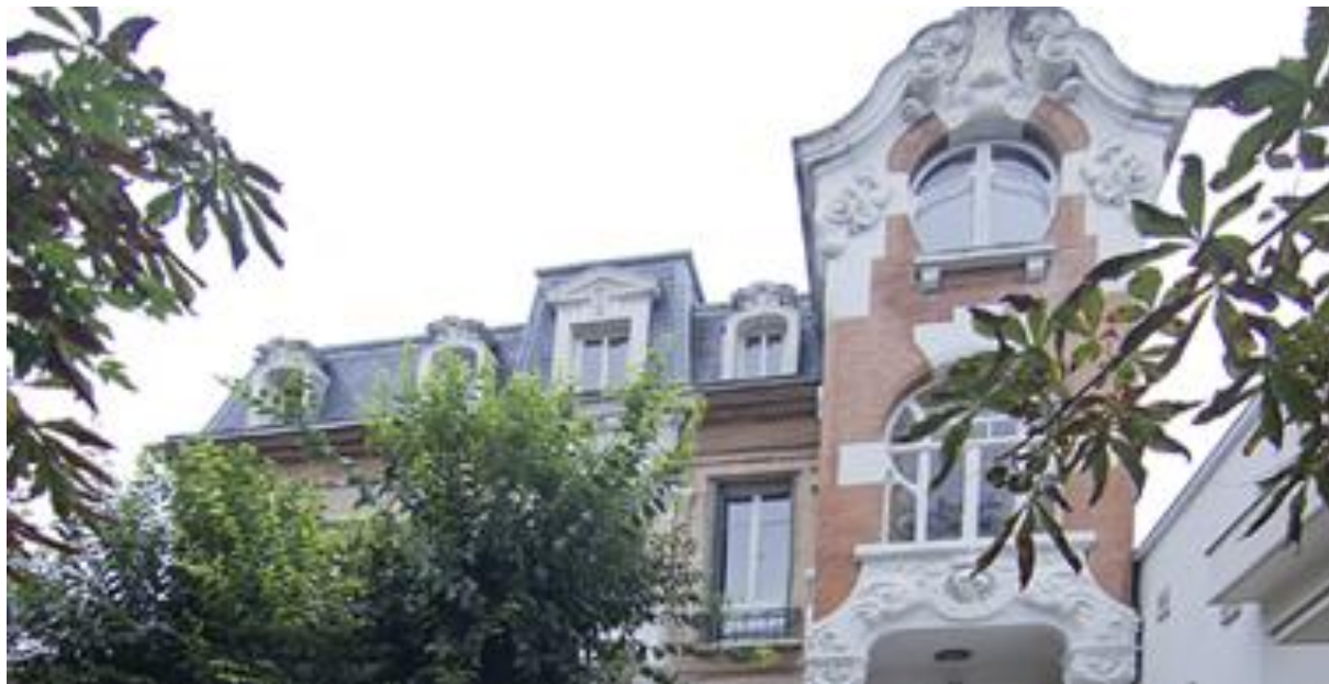
Instituto Cervantes, Toulouse.