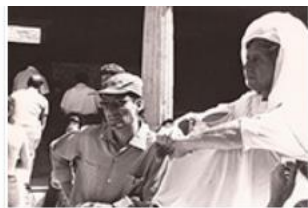
Con el actor Jack Gilford en la película Golfus de Roma , 1975.