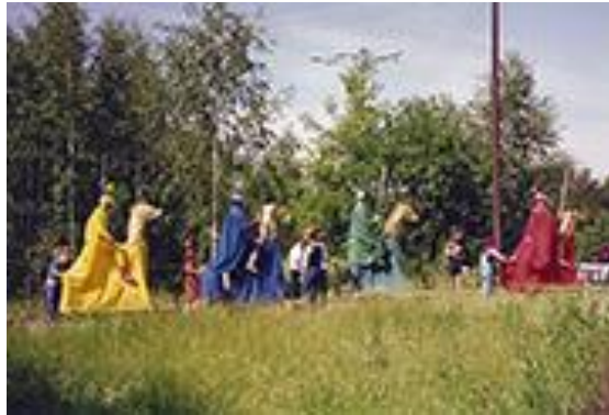
La fiesta de los dragones. Parque Lenin, Ekaterinburgo, Rusia, 1993.