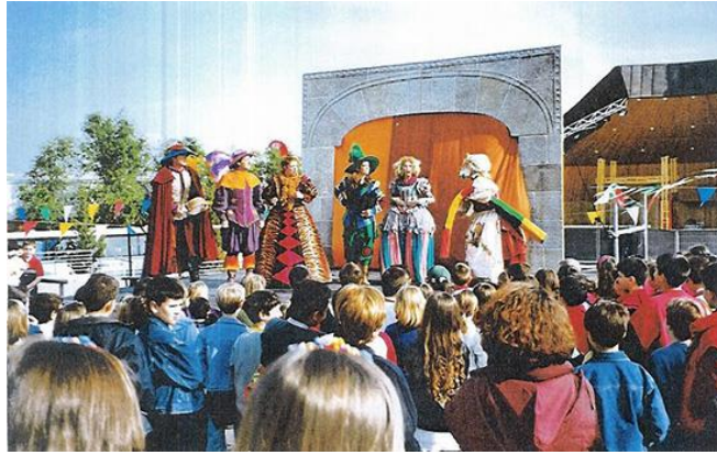
La fiesta de los comediantes.