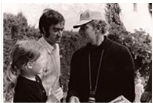
Con Charlton Heston en el rodaje de Marco Antonio y Cleopatra , 1971.