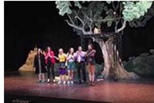
El árbol de Julia. Compañía a flote, Teatro, 2015