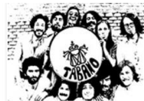
Con el grupo Tabano, 1971