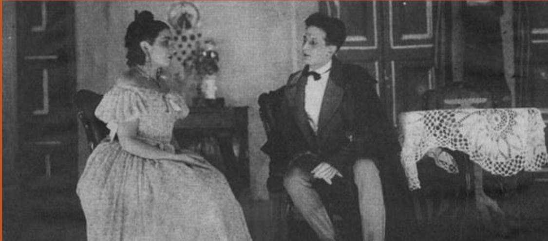
Estreno de Mariana Pineda