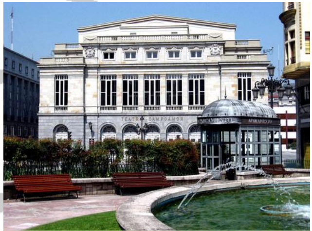
Teatro Campoamor, Oviedo (Asturias)

¡Pobre Carolina mía, nunca la podré olvidar! Ved lo que el mundo decía viendo el féretro pasar: Un clérigo: ¡Empiece el canto! El doctor: ¡Cesó de sufrir! El padre: ¡Me ahoga el llanto! La madre: ¡Quiero morir! Un muchacho: ¡Qué adornada! Un joven: ¡Era muy bella! Una moza: ¡Desgraciada! Una vieja: ¡Feliz ella! ¡Duerme en paz! -dicen los buenos-. Un filósofo: ¡Uno menos! Un poeta: ¡Un ángel más!